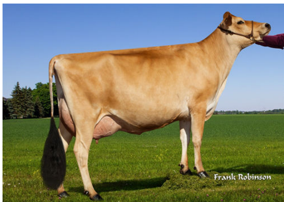
PROGENESIS MADISON- GRANDDAM